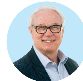
Oliver Krischer Minister für Umwelt, Naturschutz und Verkehr des Landes Nordrhein-Westfalen